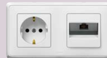
Розетка 2K+3 и розетка RJ45